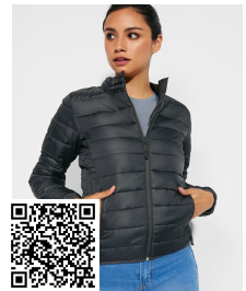
FINLAND WOMAN RA5095