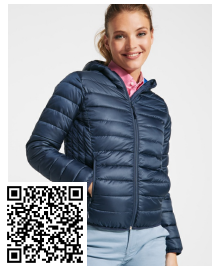
NORWAY WOMAN RA5091